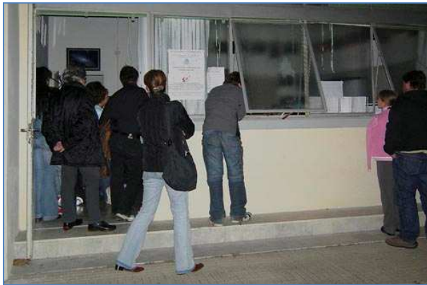
Posti in piedi