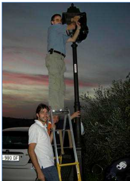
Lotta all'inquinamento luminoso