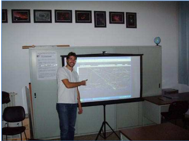
La lezione di Alex