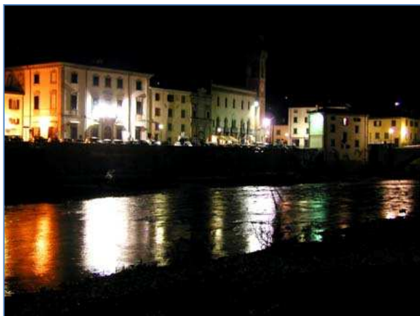
Santa Sofia by night