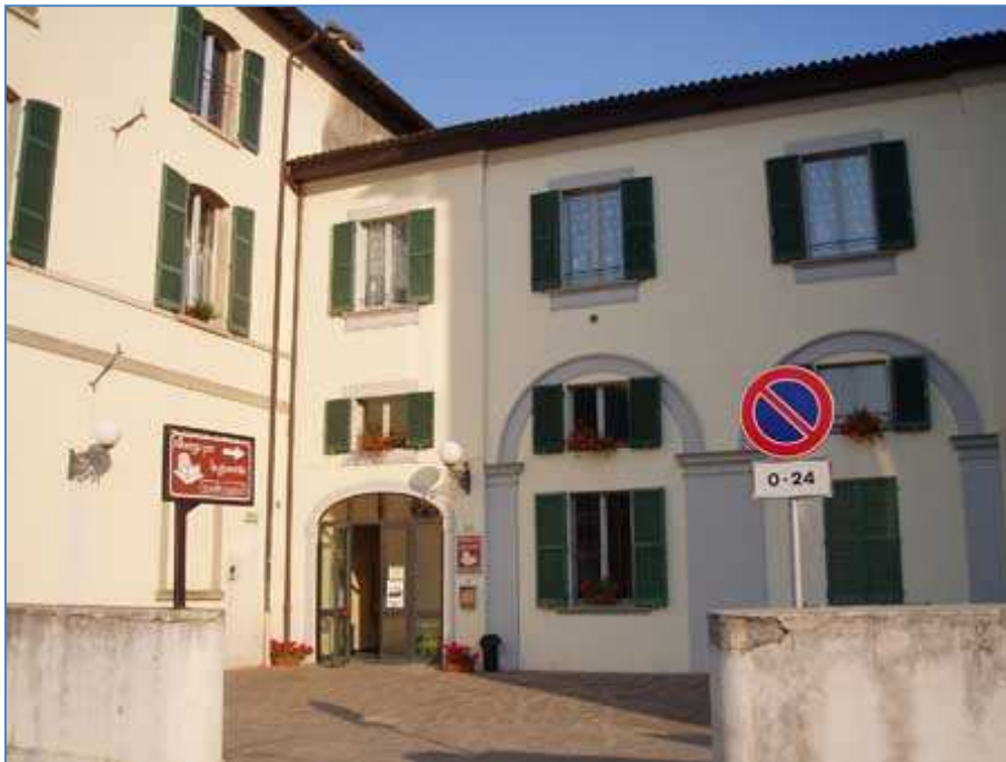
L'ostellato che ci ha ospitato