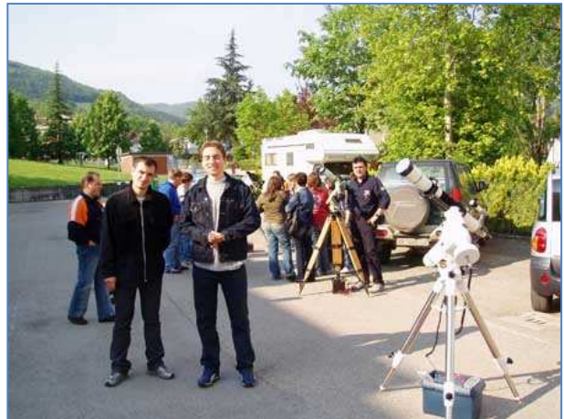
Osservazioni con gli scolari