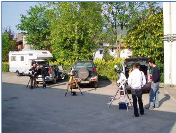
I nostri telescopi