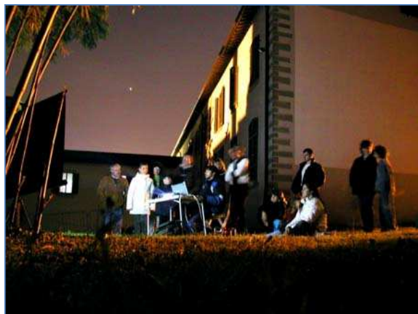
Osservazioni e lezioni notturne dal parco Giorgi