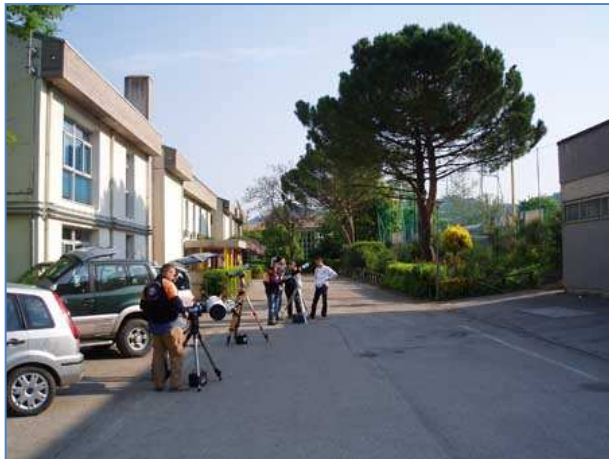
Telescopi alla scuola