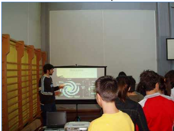
La lezione di Alex