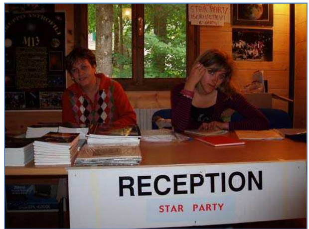
Ire & Ivana alla reception