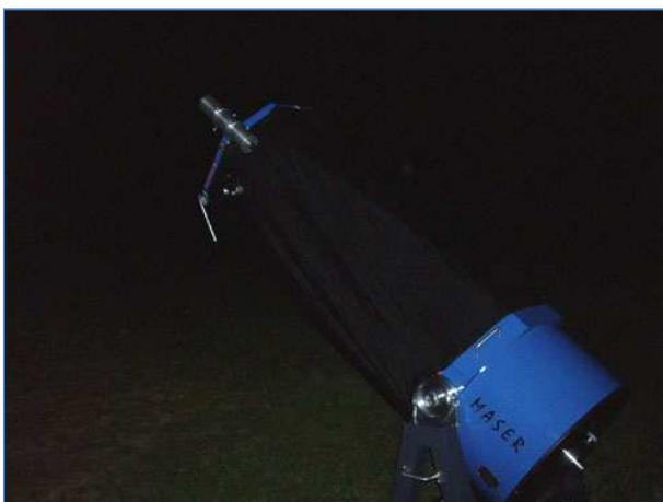
Superdobson da 60cm!!!