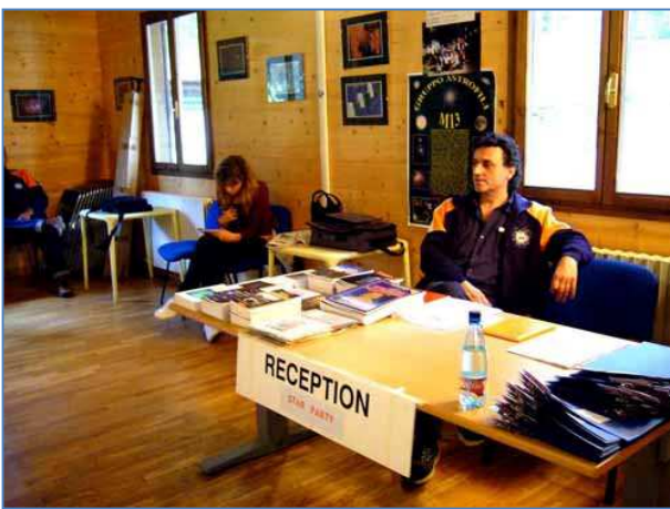
Tibe alla reception