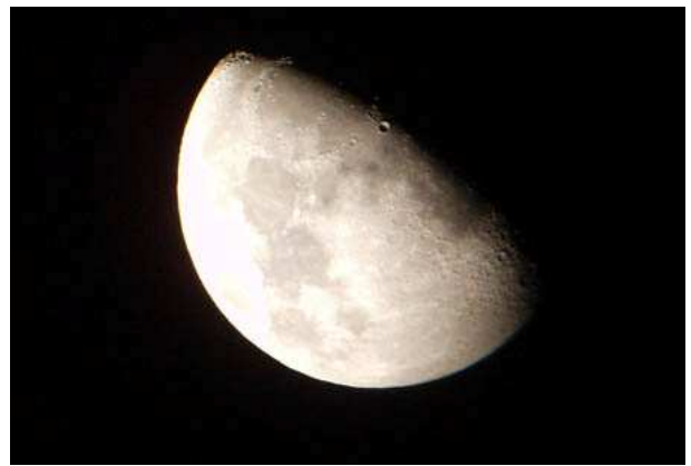
La Luna della sera