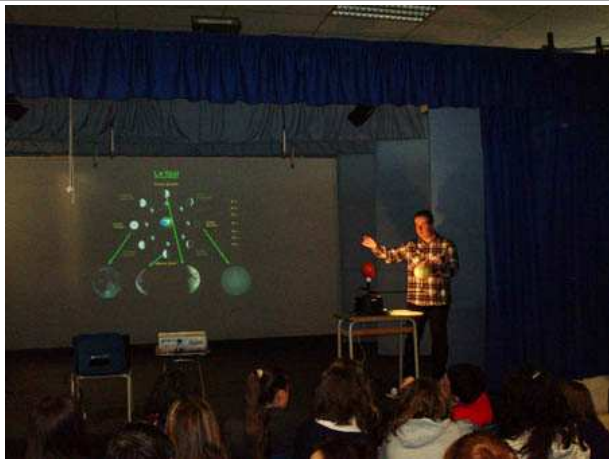
Lezione di Andrea