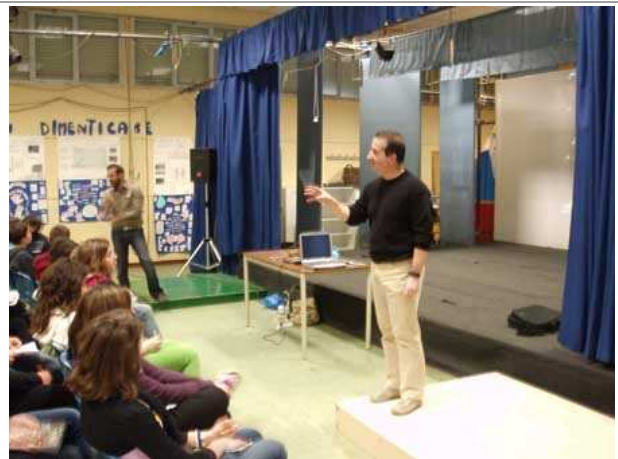
Lezione di Andrea