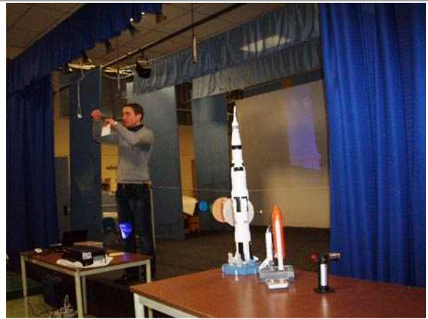
Lezione di Massimo