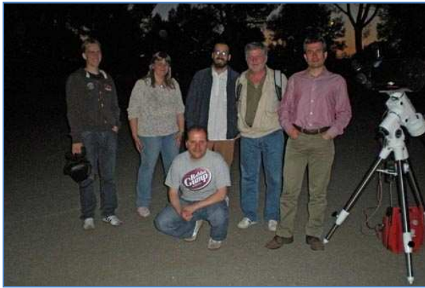
Il gruppo con il prof