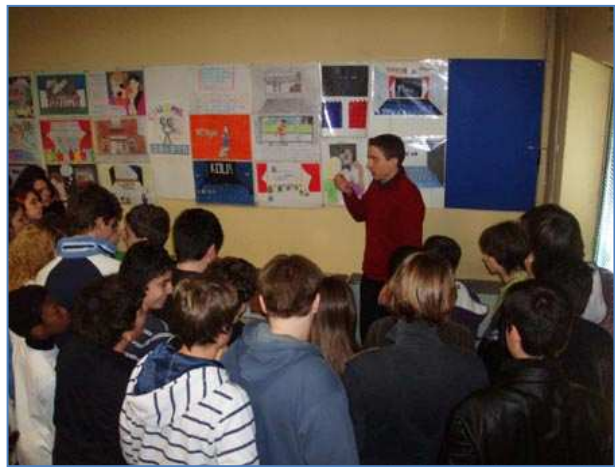
Lezione di Massimo