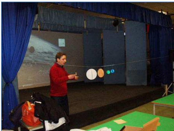
Lezione di Massimo