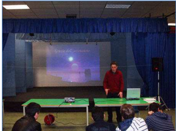
Lezione di Massimo