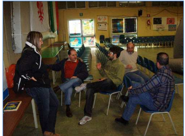
Il gruppo al lavoro