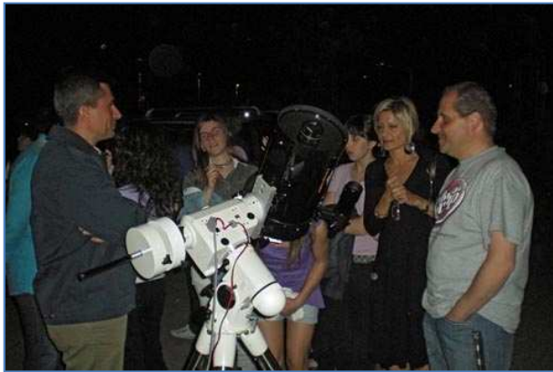
La prof al telescopio