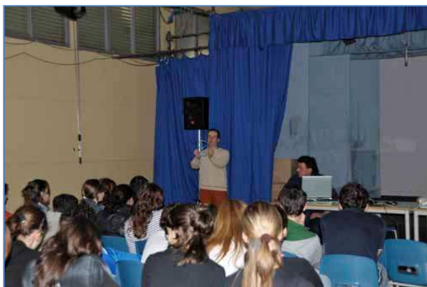
La lezione di Andrea