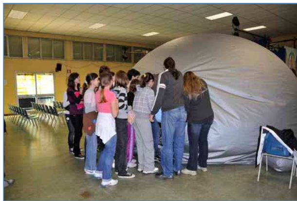
Ingresso al planetario