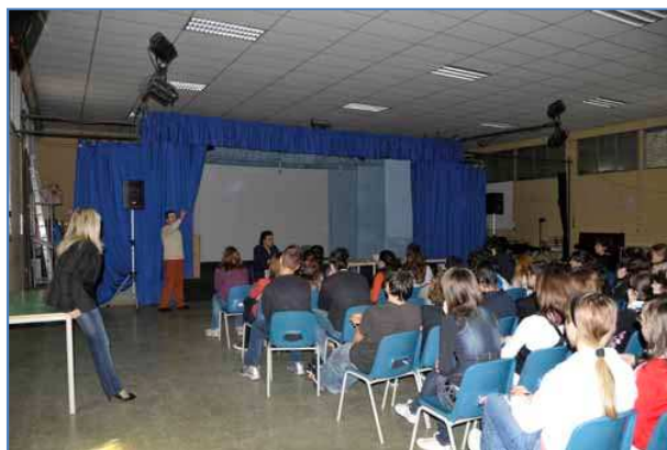
La lezione di Andrea