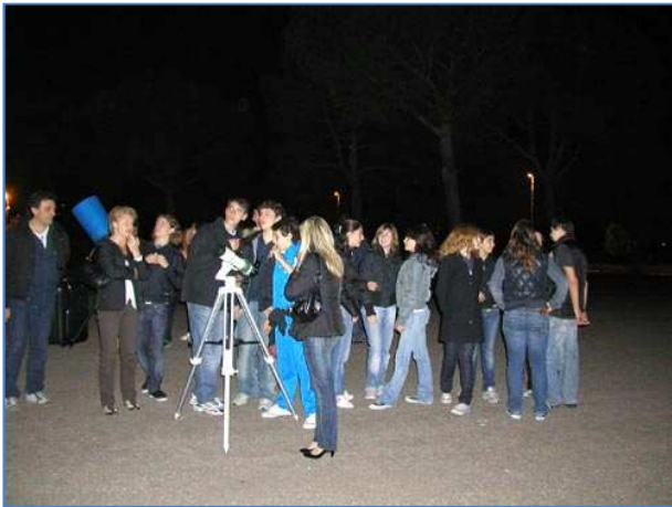
La serata osservativa