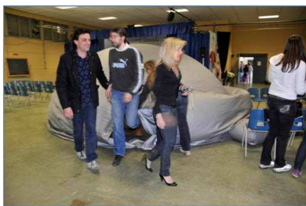
Uscita dal planetario