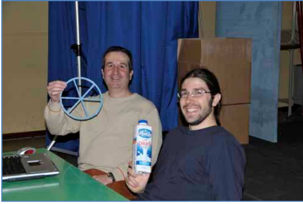
I fisici con i loro strumenti di lavoro