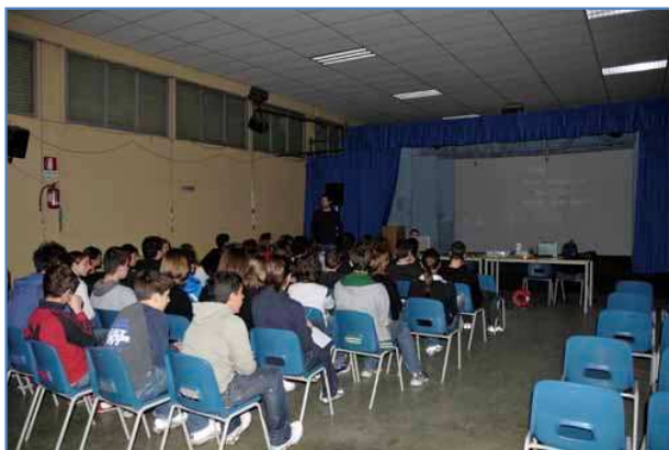
La lezione di Alex