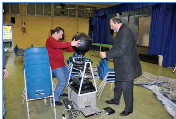
Montaggio del planetario