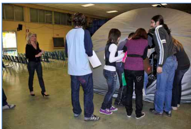
Ingresso al planetario