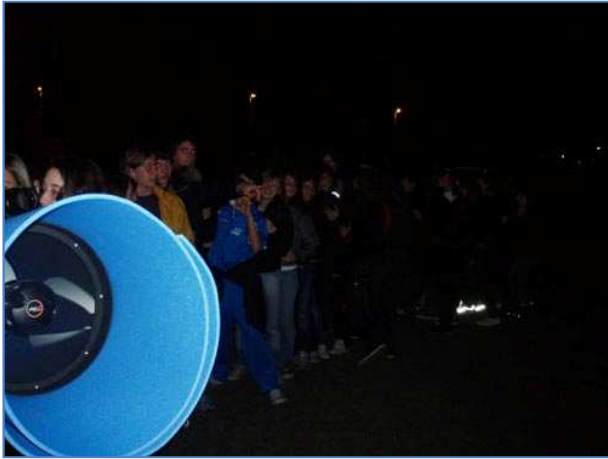
Coda al telescopio