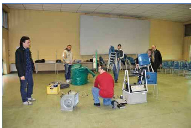
Allestimento della sala